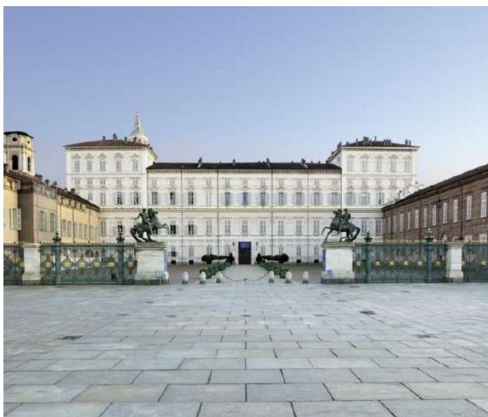
Fachada principal del Palacio Real

También en Piazza Castello te encontrarás con la residencia principal de la familia real de Saboya, desde que Turín se convirtiese en la capital de los Estados de Saboya, en 1563. Y aunque podrás visitar las salas más importantes y deslumbrantes del palacio durante todo el año, hay algunas que solo se encuentran abiertas en ocasiones. Destacan entre todas, la sala del trono, la de audiencias y la de los guardaespaldas.