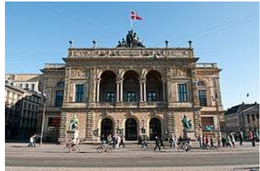
Hotel d'Anglaterra y Teatro Real en Kongens Nytorv.

Sin embargo, lo mejor de la plaza se encuentra en Nyhavn , el Puerto Nuevo (o viejo, más bien, aunque haya que ignorar la traducción auténtica), un pequeño canal de unos quinientos metros alrededor del cual hay inconfundibles edificios de fachadas con muchos colores diferentes. Es, principalmente, un lugar para turistas, con restaurantes y terrazas en la calle- bastante caras, por cierto-, aunque eso no quita que, en cuanto sale un poco el sol, los daneses se sienten en el borde del canal para tomarse una cerveza o simplemente para dar un paseo.