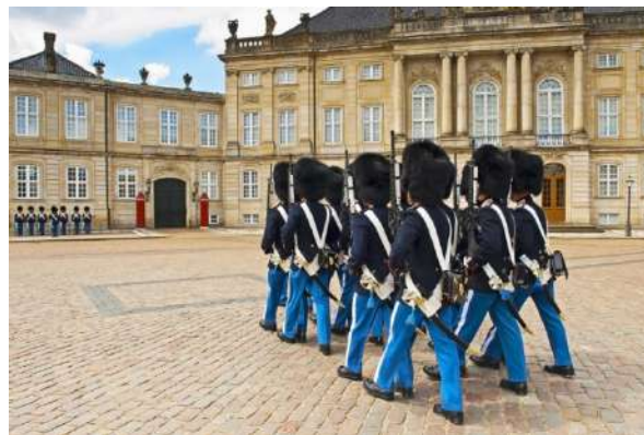
Iglesia de Mármol o de Federico y el cambio de la Guardia en el palacio de Amalienborg.

En frente de Amalienborg, al otro lado del canal, está la Operahus København, construida en 2005.