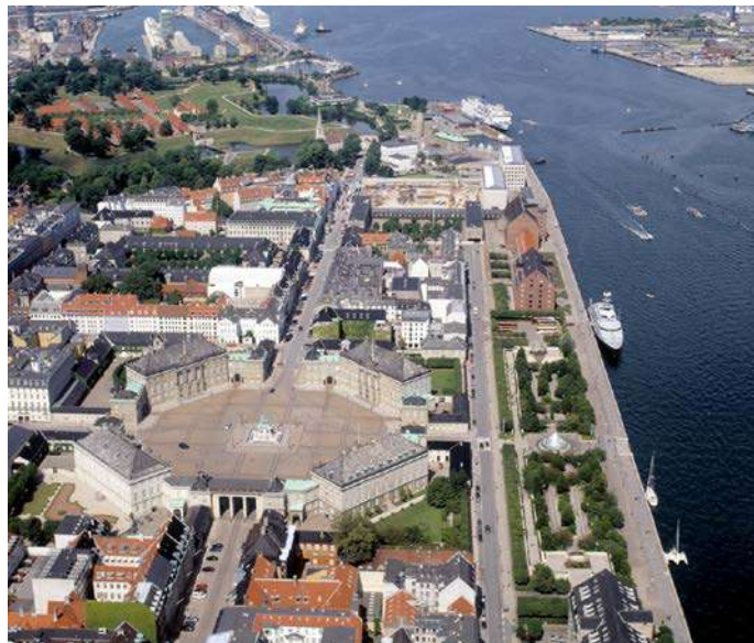
Plaza octogonal del palacio de Amalienborg y alrededores.

Si se sigue un poco más hacia el este -alrededor de un kilómetro- aparecerá la famosa estatua de la Sirenita que todo el que pase por Copenhague no puede dejar de ver. Durante el paseo, quedan un lado el museo de la Resistencia, inconfundible con su vehículo militar a la puerta, y la zona del Kastellet , una antigua fortaleza militar por la que hoy en día se puede pasear tranquilamente.