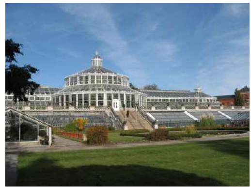
Castillo de Rosenborg y jardín Botánico