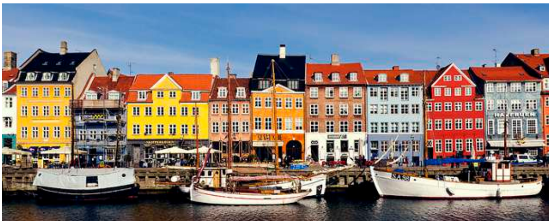
Nyhavn es una de las zonas más habituales para el visitante que va de turismo a Copenhague.

Es un lugar ideal para dar una vuelta y hacer las mejores fotos de la ciudad. Para quien quiera ver Copenhague desde los canales- que son escasos, pero desde los que se pueden ver algunas de las vistas más bonitas de la ciudad-, desde allí sale el barco turístico que recorre tanto el canal que separa la ciudad de la isla de Amager como los más pequeños que recorren el barrio de Christianhavn y rodean el Parlamento.