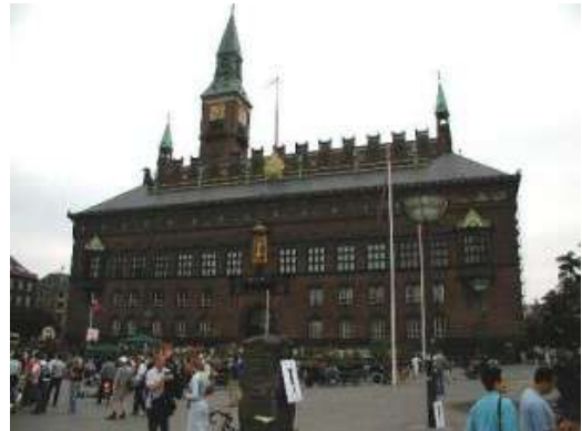
Ayuntamiento de Copenhague en Rådhuspladsen, una de las principales plazas de la ciudad.

En el Strøget está la tienda de diseño danés Illums Bolighus . Es un centro comercial con muchas tiendas independientes, pero casi todas tienen en común que representan el diseño más innovador en ropa, muebles, cositas para la casa, etc.