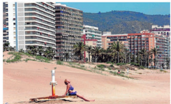
Una bañista toma el sol en la playa de Cullera.

El TSJ todavía tiene que resolver 75 recursos mientras los afectados manifiestan su satisfacción