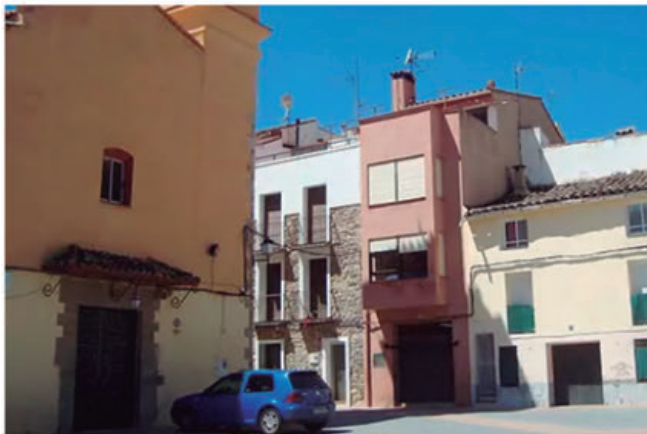
Una plaza en el municipio de Torrechiva. E. M.

Órganos superiores como la Dirección General de Urbanismo trasladan al equipo redactor del PGE-POP del municipio su preocupación por el «atragantamiento» de trámites a seguir