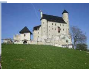
Castillo de Bobolice