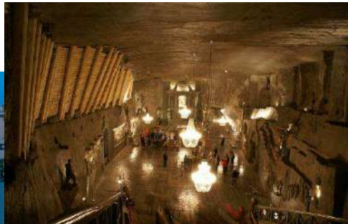
Minas de Sal de Wieliczka