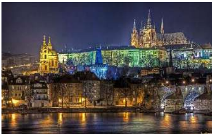
Krakow desde el Vístula