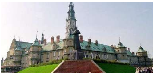
Czestochowa. Santuario Jasna Gora