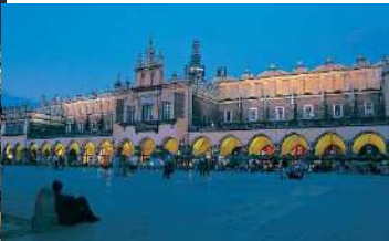
Lonja de los Paños