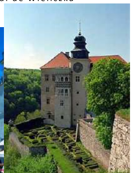
Castillo Pieskowa Skała

El viaje se ha organizado a través de la Agencia Viajes Transvia, con los vuelos siguientes de la compañía Ryanair: